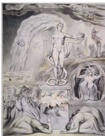
Рисунок к поэме Дж. Мильтона «На утро Рождества Христова» (1804-1811)

Поэтому не удивительно, что в цикле «Fearful Symmetry» (1981), включающем 6 песен для голоса и инструмента – органа или фортепиано, симметричность воплотилась как в форме, так и в музыкальном языке. Первая песня цикла «To Apollo» («Аполлону») написана на текст первой 9-строчной строфы стихотворения «Подражание Спенсеру» из сборника «Поэтические наброски». Песня состоит из 9 разделов: пара крайних основана на последовательном сцеплении терций, ближе к центру находятся разделы, состоящие из кварт и секунд, центральный раздел основан на звучании чистых