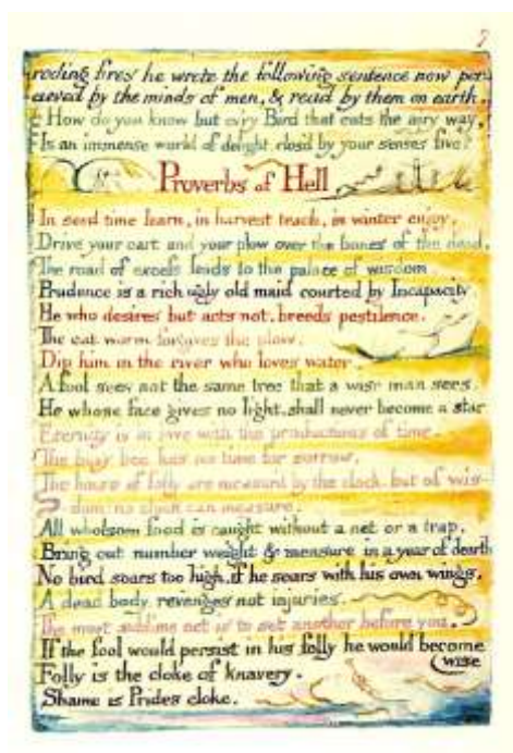
Таблица № 2

«Пословицы Ада» из иллюминированной книги «Бракосочетание Ада и Рая» (1790–1793)