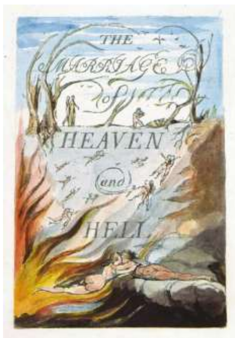
Рисунок № 7

«Пословицы Ада» из иллюминированной книги «Бракосочетание Ада и Рая» (1790–1793)