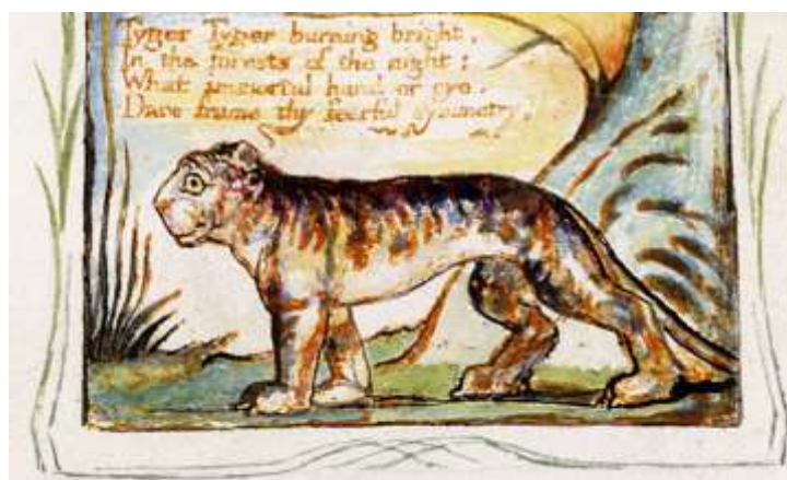
Иллюстрация к стихотворению «Тигр» из «Песен невинности и опыта» (1794, авторская копия – 1825)